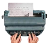
La machine à écrire

Ecrret de droite à gauche et retourne la feuille pour lire